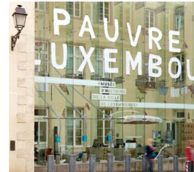
Musée d'Histoire de la Ville de Luxembourg, vue de la façade

L'exposition Pauvre Luxembourg ? permet de prendre la mesure des dimensions que revêt la pauvreté au Luxembourg et dans le monde, depuis l'époque de la formulation de la « question sociale » vers 1850 jusqu'à nos jours. Pour le Musée, c'est l'occasion de présenter des critères d'appréciation et de définition de la pauvreté et d'offrir une vue d'ensemble de cette question complexe.