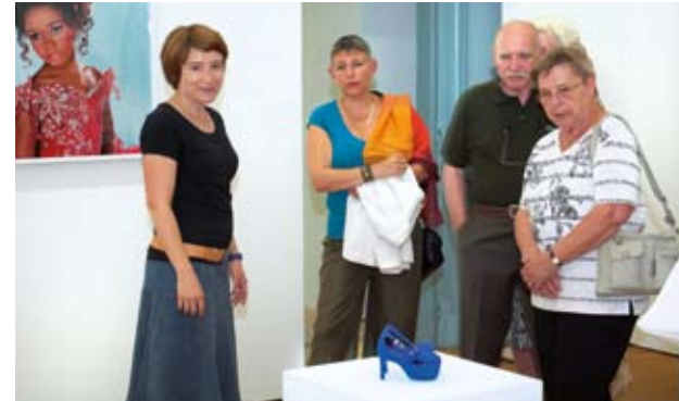
Casino Luxembourg – Forum d'art contemporain, vue de l'exposition Second Lives : Jeux masqués et autres Je

contexte socioculturel du Grand-Duché de Luxembourg et, vu l'obligation d'une exposition à la fin de la résidence, il se positionne davantage dans son rôle de plateforme de production et de création contemporaine.